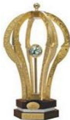
Zlatna krana za kvalitet- London 2004